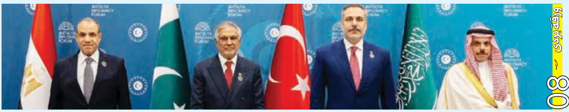
بشائره بدت بمناورة مصرية في اسلام آباد و جنود باكستانيين في الرياض