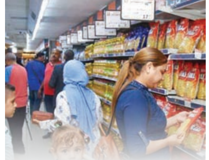
موجة غلاء وأزمة طاقة وعودة التضخم للإرتفاع ..

مواجهة ساخنة «تحت القبة» بين الحكومة والنواب بسبب المصانع المتعثرة وغياب مبادرات دعم القطاع الصناعي